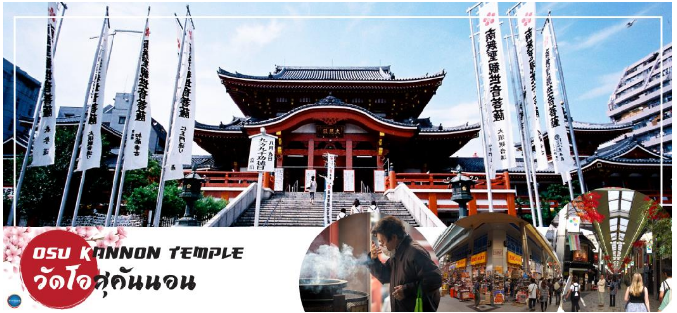
OSU KANNON TEMPLE วัดโอสถคันนอน

เช้า รับประทานอาหารเช้า ณ ห้องอาหารของโรงแรม (4) นำท่านสู่ วัดโอสถคันนอน (Osu Kannon Temple) (ใช้เวลาเดินทางประมาณ 50 นาที) เป็นวัดพุทธยอดนิยมในเมืองนาโกย่า เดิมสร้างขึ้นในสมัยคามาคุระ (ค.ศ. 1192-1333) ในจังหวัดกิฟุ การก่อสร้างได้รับการสนับสนุนจากจักรพรรดิ Go-Daigo และจากนั้นถูกย้ายมายังสถานที่ปัจจุบันเนื่องจากน้ำท่วมซ้ำซาก โดยโชกุนโทกูงาวะ อิเอยาซุ ในปี 1612 ระหว่างทางเดินไปวัด เราจะผ่านถนนช้อปปิ้ง เรียกว่า ย่านช้อปปิ้งโอส (Osu Shopping) เครือข่ายถนนช้อปปิ้งที่เก่าแก่ แต่มีเสน่ห์เต็มไปด้วยร้านค้าและร้านอาหารกว่า 400 ร้าน บางครั้งที่นี่ก็ถูกเปรียบเทียบกับย่านอากิฮาบาระของโตเกียว เนื่องจากมีร้านค้ามากมายที่เกี่ยวกับด้านเครื่องใช้ไฟฟ้า คอสเพลย์ อะนิเมะ เจปโปป และสินค้าไอดอล