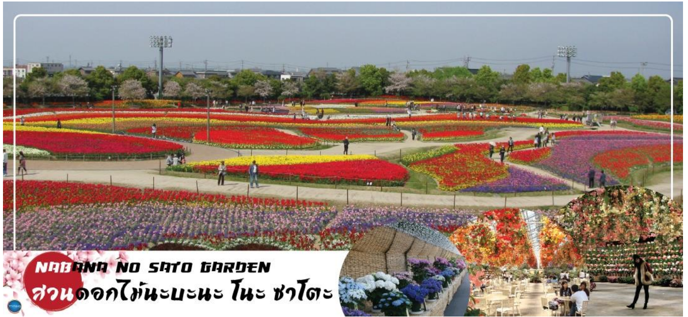
NABANA NO SATO GARDEN สวนดอกไม้มะบะนะ โนะ ซาโตะ

นำท่านเข้าชม สวนดอกไม้มะบะนะ โนะ ซาโตะ (NABANA NO SATO) (ใช้เวลาเดินทางประมาณ 50 นาที) เป็นสวนดอกไม้ที่อลังการงานและมีชื่อเสียงมากที่สุดแห่งหนึ่งของญี่ปุ่น โดยเป็นสวนขนาดใหญ่ที่มีพื้นที่มากถึง 300,000 ตารางเมตร ไม่ว่าจะมาฤดูร้อน ฤดูใบไม้ผลิ หรือฤดูไหนๆ ก็จะได้พบกับความงดงามของดอกไม้มานานาพันธุ์มากกว่า 40 สายพันธุ์ มีทั้งซากุระ ทิวลิป คอสมอส กุหลาบ ไฮเดรนเจีย และอื่นๆอีกมากมาย ที่พากันผลิดอกชูช่อต้อนรับ