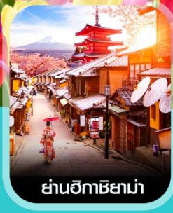
ย่านฮิกาชียามา