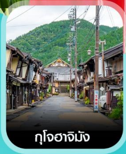
กุโงซากิมัง