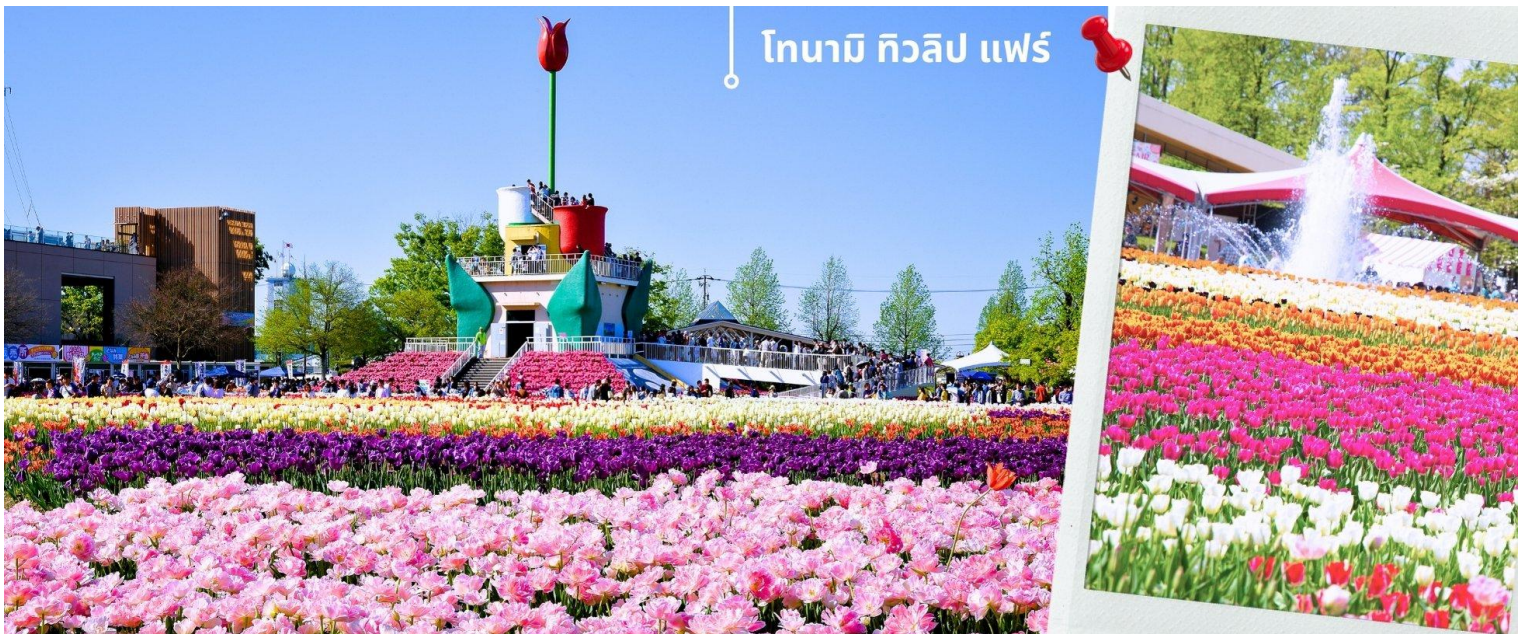
โทนามิ ทิวลิป แฟร์

เที่ยง รับประทานอาหารเที่ยง ณ ภัตตาคาร เมนูพิเศษ!! เซ็ต ชาบู ชาบู สไตล์ญี่ปุ่น (2) หลังรับประทานอาหารเที่ยง นำท่านเดินทางสู่ เมืองโทยามะ Toyama (ใช้เวลาเดินทางประมาณ 3 ชั่วโมง 45 นาที โดยระหว่างจะแวะจุดพักรถให้เข้าห้องน้ำ) เมืองโทยามะ เป็นเมืองเล็กๆ อยู่เลียบชายฝั่งทะเลญี่ปุ่น ครอบคลุมพื้นที่ทาง เหนือของภูเขาเจแปนแอลป์ ทำให้มีแหล่งท่องเที่ยวที่หลากหลาย และยังมีชื่อเรียกอีกอย่างว่า เวนิสแห่งตะวันตก เพราะเป็นเมืองที่มีแม่น้ำไหลผ่านถึง 7 สาย และอยู่ติดกับแนวเทือกเขาเจแปนแอลป์ ทำให้ที่นี่สวยงามกับภาพวาด พา ทางเดินทางชม เทศกาล โทนามิ ทิวลิป Tonami Tulip Fair งานเทศกาลนี้จัดขึ้นทุกปี ในงานจะมีการจัดแสดงดอก