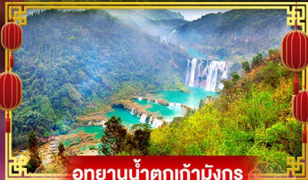
อุทยานน้ำตกเก้ามังกร