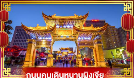
ถนนคนเดินหนานผิงเจีย