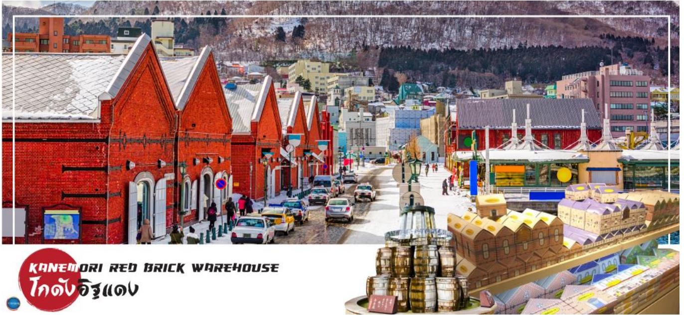
KANEMORI RED BRICK WAREHOUSE โกดังอิฐแดง

วันที่สาม เมืองฮาโกดาเตะ – ตลาดเช้าฮาโกดาเตะ – โกดังอิฐแดง – ย่านเมืองเก่าโมโตมาชิ – ป้อมโกเรียวกาคู (เข้าชม) – ทะเลสาบโทยะ – ออนเซน