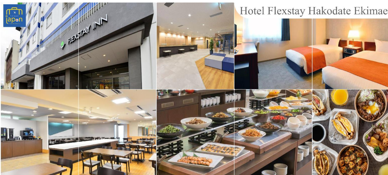
Hotel Flexstay Hakodate Ekimae

ที่พัก FLEX STAY INN HAKODATE EKIMAE หรือเทียบเท่าระดับเดียวกัน