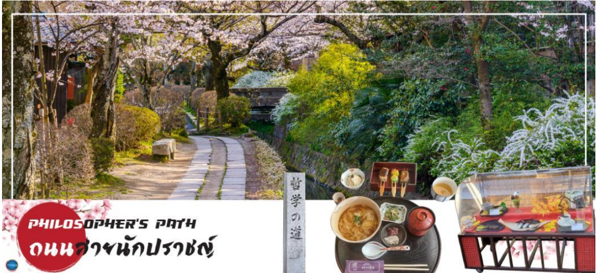
PHILOSOPHER'S PATH ถนนสายนักปราชญ์

บริเวณใกล้เคียงก็นำท่านเดินชม และช้อปปิ้ง ถนนสายนักปราชญ์ (Philosopher's Path) หรือ Tetsugaku no Michi เป็นถนนทางเดินเล็กๆ เลียบคลองส่งน้ำทะเลสาบบิวะ (Lake Biwa Canal (Biwako-sosui)) ตั้งอยู่ทางตะวันออกของเมืองเกียวโต (Kyoto) โดยเริ่มต้นตั้งแต่ใกล้ๆ กับวัดกินคะคุจิ (Ginkakuji Temple) ยาวมาจนถึงใกล้ๆ กับบริเวณวัดเอคันโด (Eikando Temple) และวัดนันเซ็นจิ (Nanzenji Temple) รวมเป็นระยะทางประมาณ 2 กิโลเมตร โดยตลอดเส้นทางนั้นก็เรียงรายไปด้วยต้นซากุระประมาณ 500 ต้น จึงเป็นจุดชมซากุระยอดนิยมในช่วง