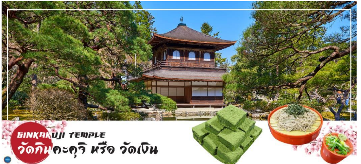
GINKAKUJI TEMPLE วัดกินคะคุจิ หรือ วัดเงิน

วันที่สอง เมืองเกียวโต – วัดกินคะคุจิ หรือ วัดเงิน – ถนนสายนักปราชญ์ – การเรียนพิธีชงชาญี่ปุ่น – เมืองมิโนะ – วัดคัตสึโอะจิ – เมืองโอซาก้า – เอ็กซ์โปซิต์ (จุดชมซากุระชั้นกับภูมิอากาศ)