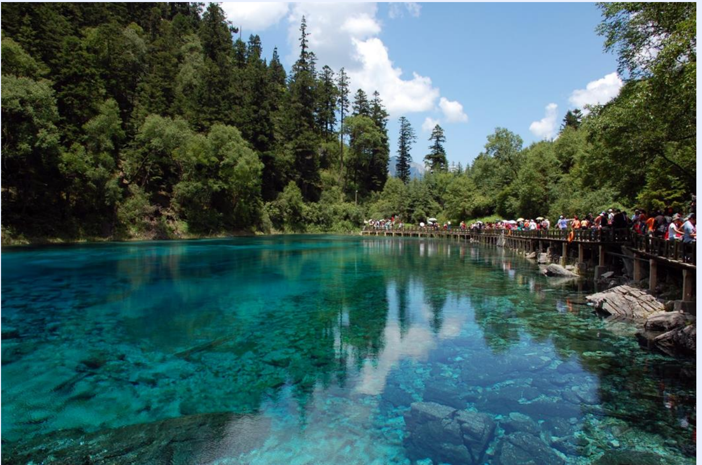
ฤดูใบไม้ผลิ (SPRING)

หมายเหตุ : โปรแกรมนี้ไม่รวมรถเหมาภายในอุทยานฯ หากท่านต้องการรถเหมาภายในอุทยาน มีค่าใช้จ่ายเพิ่มเติม สามารถสอบถามเพิ่มเติมจากไกด์ท้องถิ่นและหัวหน้าทัวร์