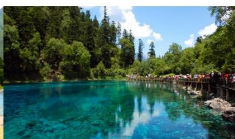
อุทยานแห่งชาติจิวฉ่ายโกว