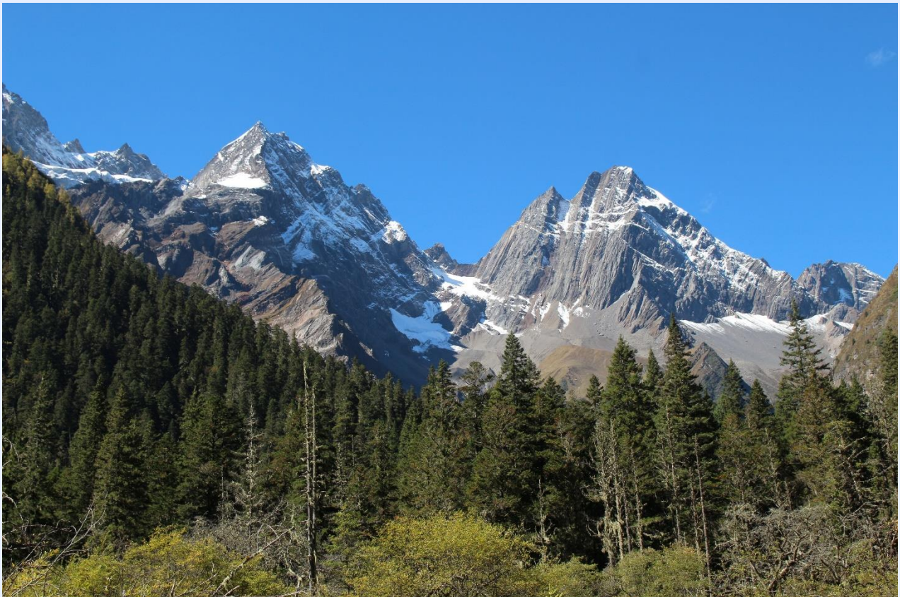
ฤดูใบไม้ผลิ (SPRING)