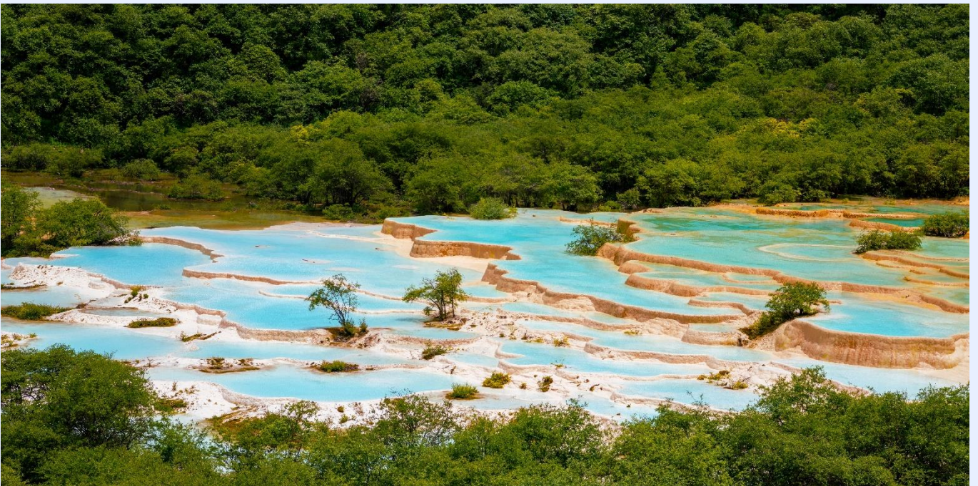
ฤดูใบไม้ผลิ (SPRING)