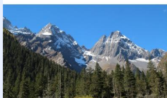
ภูเขาสี่ดรุณี (หุบเขาช่องเจียวโกว)