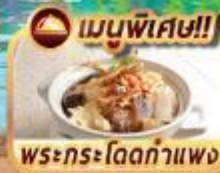
พระกระโดดกำแพง