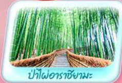
ป่าไผ่อาราชิยามะ