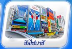
ชินไซบาชิ