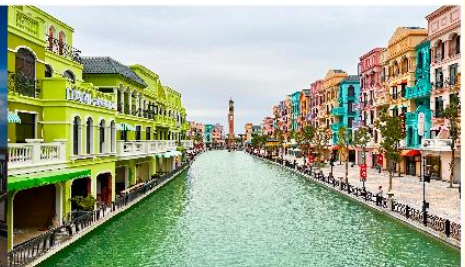
เมก้าแกรนด์เวิลด์ฮานอย

*ทางบริษัทฯ ขอสงวนสิทธิ์ในการสลับโปรแกรมทัวร์ตามความเหมาะสมขึ้นอยู่กับสถานการณ์หน้างาน โดยคำนึงถึงผลประโยชน์ของลูกค้าเป็นสำคัญ