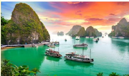
ล่องเรือชมอ่าวฮาลอง