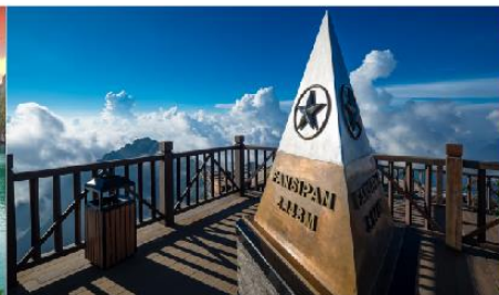
ยอดเขาฟานซิปิน