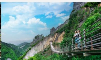
หุบเขารอยแยกอุ๋หลิงซาน