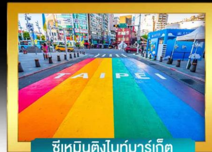
ซีเหมินติงไนท์มาร์เก็ต