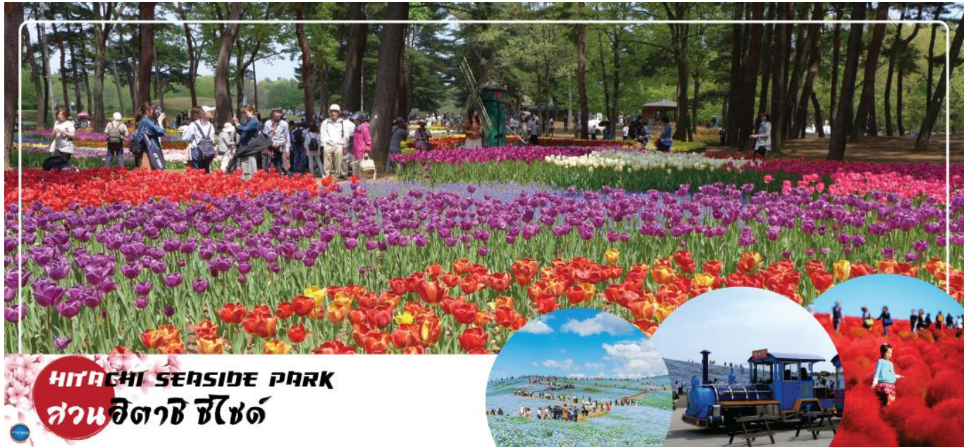
HITACHI SEASIDE PARK สวนฮิตาชิ ซีไซด์

02.25 น. เหนือฟ้าสู่ เมืองนาริตะ ประเทศญี่ปุ่น โดยเที่ยวบินที่ XJ602