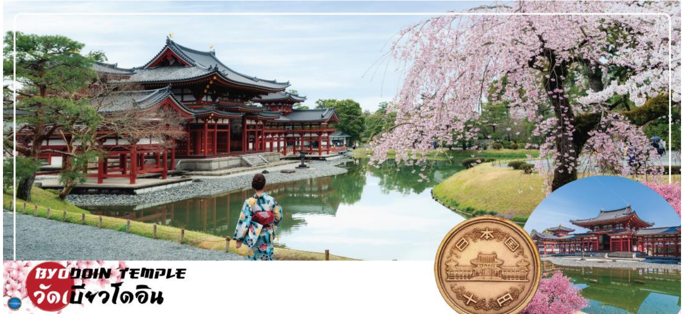
BYODOIN TEMPLE วัดเบียวโดอิน

วันที่สอง ท่าอากาศยานนานาชาติคันไซ โอซาก้า ประเทศญี่ปุ่น – เมืองเกียวโต – เมืองอุจิ – วัดเบียวโดอิน (จุดชมซากุระขึ้นกับภูมิอากาศ) – ถนนเบียวโดอิน โอโมเตะซันโด (ถนนชาเขียว) – สะพานอุจิ – เมืองนาโกย่า – แจ๊ซ ดริม เอ๊าท์เล็ท