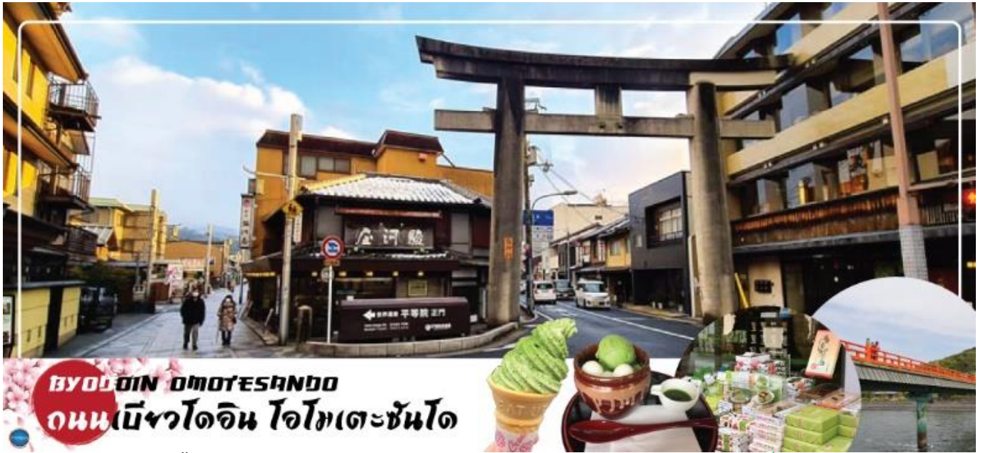
BYODOIN OMOYESANDO ถนนเบียวโดอิน โอโมเตะซันโด

กาชาปอง, ตู้อิสกริม, และตุ๊กต่น้ำ ที่ใช้โทนสีให้เข้าธีมถนนชาเขียวรวมถึงน้ำและขนมในตุ๊กตก็เป็นรสชาติเขียวทั้งหมด เมื่อท่านเดินทางสุดถนนแล้ว จะเจอ สะพานอุจิ (Uji Bridge) หนึ่งในสามสะพานเก่าแก่ที่สุดในญี่ปุ่น สร้างขึ้นในปี ค.ศ. 646 อายุคร่าวๆ ประมาณ 1,370 ปี เกือบพังทลายมาแล้วหลายครั้งจากสงคราม น้ำท่วม และแผ่นดินไหว แต่ทุกครั้งชาวเมืองก็ร่วมพลังกันซ่อมแซมจนกลับมาใช้งานได้อีกครั้งและยึดหยัดมาจนถึงวันนี้ กลายเป็นมรดกทางประวัติศาสตร์ของชาวเมืองอุจิ