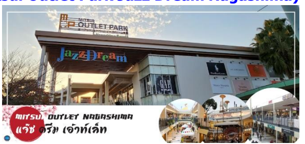
มิตซู อีท์เอาท์พาร์ค แจ๊ซ ดรีม เอ้าท์เล็ต

นำท่านช้อปปิ้งสินค้า แจ๊ซ ดรีม เอ้าท์เล็ต (Mitsui Outlet Park Jazz Dream Nagashima) สถานที่ที่รวบรวมสินค้าแบรนด์เนม และสินค้าแบรนด์ญี่ปุ่น โกอินเตอร์มากกว่า 240 ร้านค้า มากที่สุดในประเทศ ให้ท่านได้เลือกซื้อสินค้า เสื้อผ้า อาทิ MK Michel Klein, Morgan, Ecco, United Colours of Benetton, Lacoste ฯลฯ กระเป๋า Bally, Coach, Gucci, Gap, Armani เลือกดูเครื่องประดับ และนาฬิกาอย่าง G-Shock, Seiko, Tag Heuer, Agete, S.T.Dupont, Tasaki, Longines ฯลฯ รองเท้าแฟชั่นและกีฬา Adidas, Nike, Kappa, Hush Puppies ฯลฯ และสินค้าอื่นๆ อีกมากมายซึ่งอยู่ในพื้นที่เดียวกันทั้งหมด