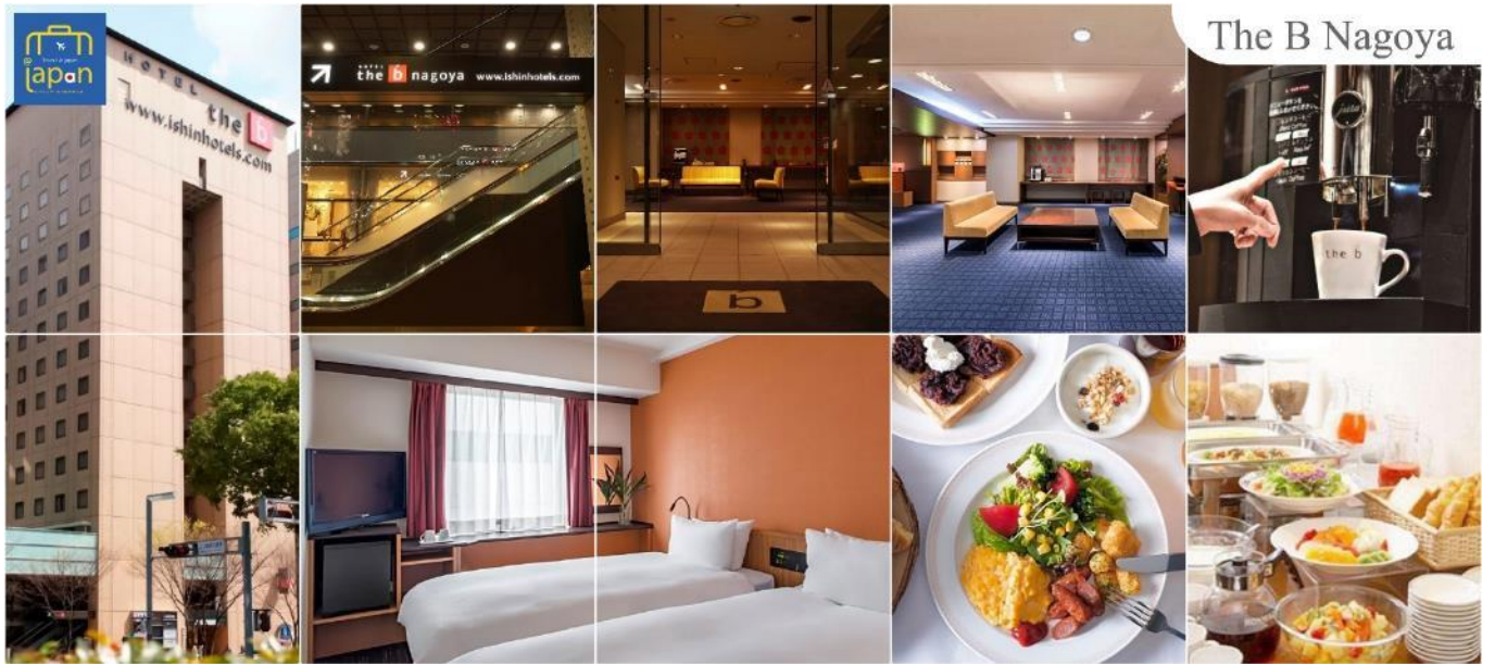
The B Nagoya