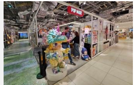
POP MART สายจุ่มถูกใจสิ่งนี้ !