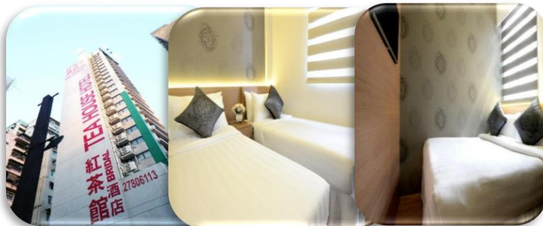
WE HOTEL โรงแรมระดับ ☆☆☆