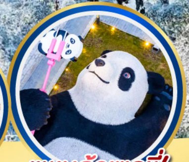
แพนด้าเซลฟี