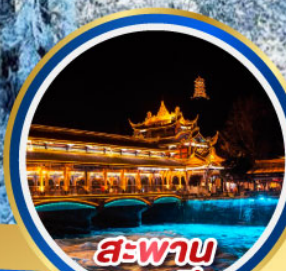
สะพาน หนานเจียว