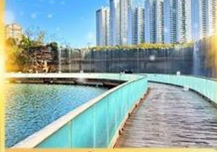
สวนน้ำตกคุณหมิง