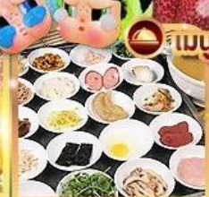
ขนมจีนข้ามสะพาน