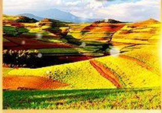
แผ่นดินสีแดงตงชวน