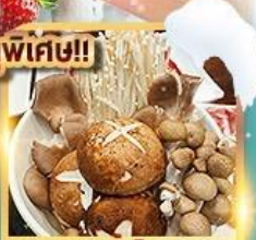
สุกี้เห็ด