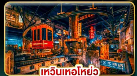
เหวินเหอโฮ่ย