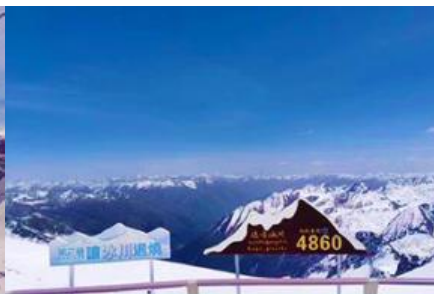
อุทยานสวรรค์ภูผาหิมะการ์เซียต้ากู่