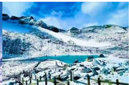
ทะเลสาบต้ากู่

วันที่ 1 เมืองเหยลู่ยี่-อุทยานภูเขาคาร์เซียต้ากู่ปิงชว่น (รวมค่ากระเช้าขึ้น-ลง) - รถเมล์ในอุทยาน- เหยลู่ยี่