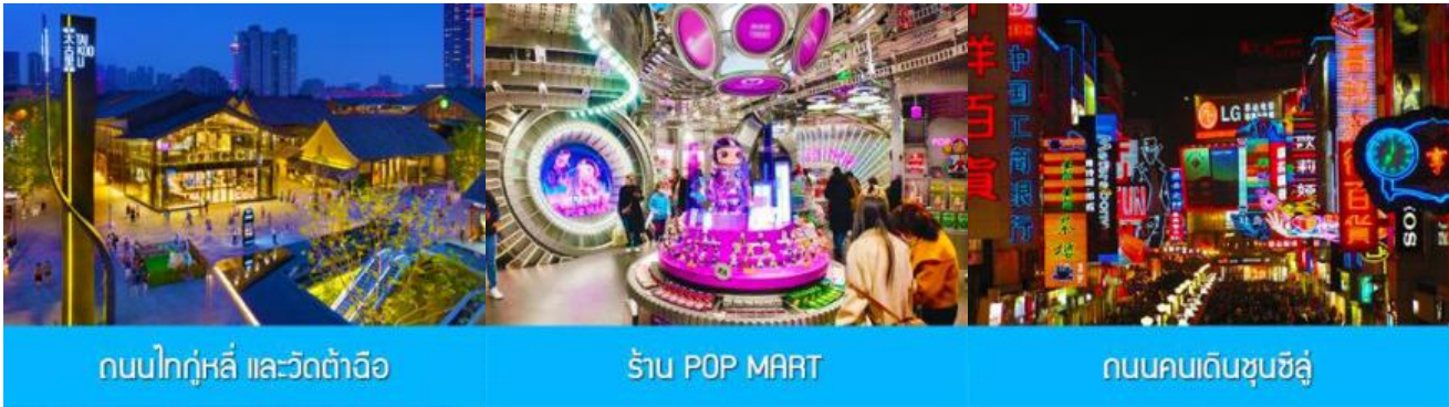
ถนนไท่กู่หลี่ และวัดต้าฉือ