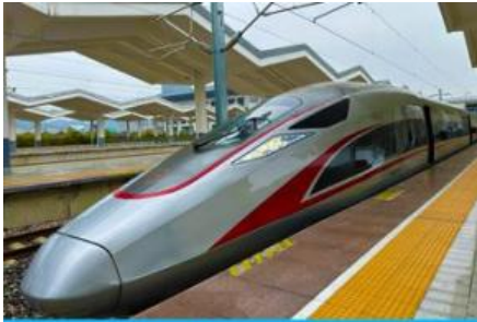
เบ็รรถไฟความเร็วสูง

เดินทางถึง สนามบินเทียนฟู เมืองเฉิงตู 成都天府机场 นำคณะผ่านพิธีการตรวจคนเข้าเมืองและศุลกากร นำคณะเดินทางสู่โรงแรมที่พักในเมืองเฉิงตู (เวลาในประเทศจีนจะเร็วกว่าเวลาในประเทศไทย 1 ชั่วโมง) เมืองเฉิงตูเป็นเมืองเอกของมณฑลเสฉวน เป็นหนึ่งในมหานครที่มีประชากรมากที่สุดของจีน เป็นเมืองประวัติศาสตร์เก่าแก่ และเป็นศูนย์กลางการเมืองการปกครอง การศึกษาและการคมนาคมขนส่งเป็นแหล่งกำเนิดของหมี่แพนด้า และเป็นประตูสู่แหล่งท่องเที่ยวระดับโลก ทั้งอุทยานจิวจ้ายโกว และอุทยานหวงหลง พักที่ RAYFONT HOTEL โรงแรมระดับ 4 ดาวห้องถึ้น หรือเทียบเท่า