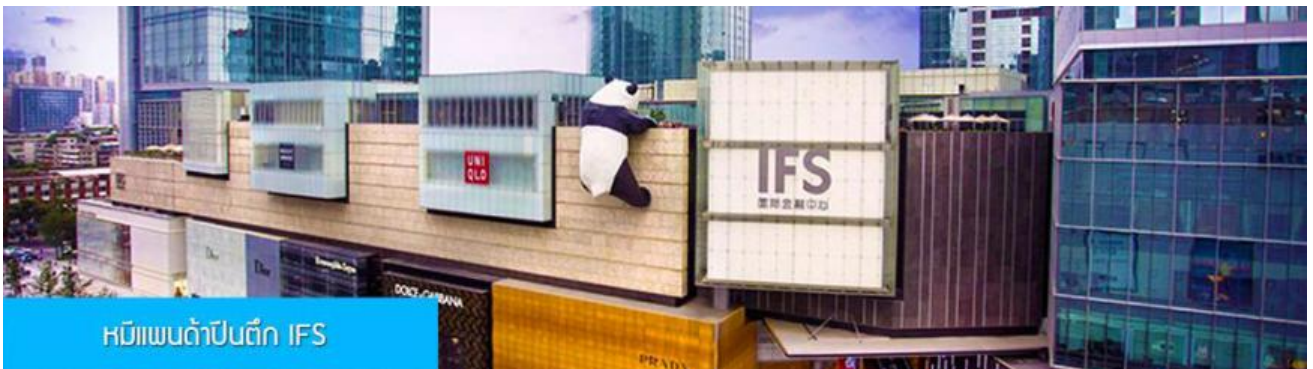
หมีแพนด้าปีนตึก IFS