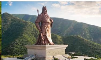
บ้านเกิดท่านกวนจู