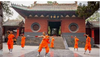
ชมโชว์กังฟูเล่าหลิน

*ทางบริษัทฯ ขอสงวนสิทธิ์ในการสลับโปรแกรมทัวร์ตามความเหมาะสมขึ้นอยู่กับสถานการณ์หน้างาน โดยคำนึงถึงผลประโยชน์ของลูกค้าเป็นสำคัญ