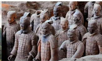
สุสานทหารจีนซี