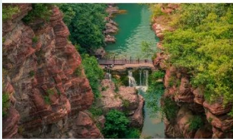
อุทยานสวรรค์หยุนโถซาน