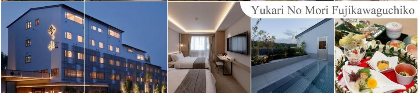
Yukari No Mori Fujikawaguchiko