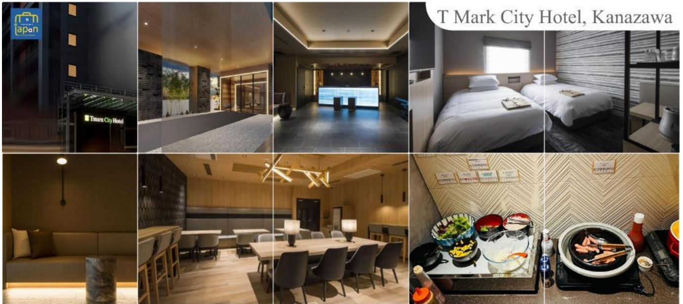
T Mark City Hotel, Kanazawa