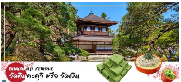
GINKAKUJI TEMPLE วัดกินคะคุจิ หรือ วัดเงิน

จากนั้นนำท่านสู่ วัดกินคะคุจิ (Ginkakuji Temple) หรือ วัดเงิน (ใช้ระยะเวลาในการเดินทางประมาณ 15 นาที) เป็นอีกหนึ่งในสถานที่ที่ขึ้นทะเบียนกับองค์การยูเนสโกให้เป็นมรดกโลกด้านวัฒนธรรม ซึ่งวัดกินคะคุจิเป็นวัดนิกายเซน ถูกสร้างขึ้นโดยโชกุนอชิคากะ โยชิมาสะ หลานชายของท่านโชกุน ที่สร้างวัดกินคะคุจิ (Kinkakuji Temple) หรือ ที่รู้จักกันอย่างกว้างขวางว่าวัดทองสำหรับอาคารของวัดเงิน สร้างขึ้นในรูปแบบเดียวกัน เพียงแต่จะไม่ได้มีสีทอง เป็นอาคาร 2 ชั้น และมีนกฟีนิกซ์อยู่บนหลังคา