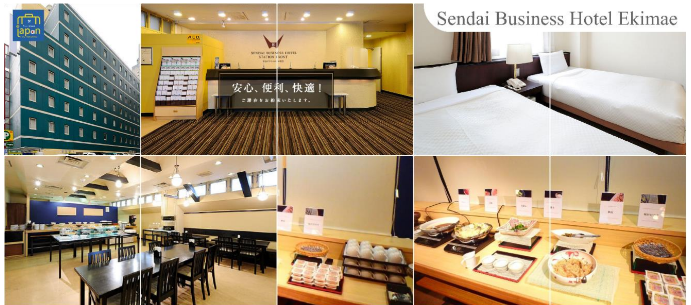
Sendai Business Hotel Ekimae

SENDAI BUSINESS HOTEL EKIMAE หรือเทียบเท่าระดับเดียวกัน