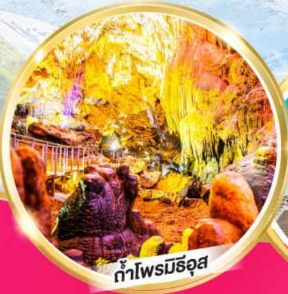
ถ้ำโพรมีธูส