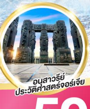
อนุสาวรีย์ประวัติศาสตร์จอร์เจีย