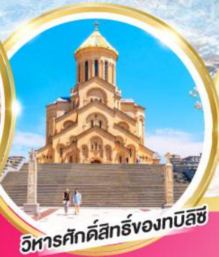
วิหารศักดิ์สิทธิ์ของทบิลีซี