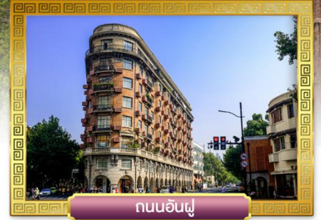
ถนนอันฟู