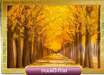
ถนนแปะก๊วย