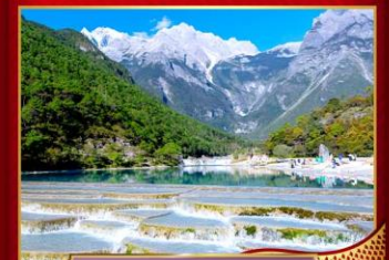
ทะเลสาบไป๋ซุยเหอ