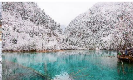
อุทยานแห่งชาติจิวจ้ายโกว

*ทางบริษัทฯ ขอสงวนสิทธิ์ในการสลับโปรแกรมทัวร์ตามความเหมาะสมขึ้นอยู่กับสถานการณ์ปัจจุบัน โดยคำนึงถึงผลประโยชน์ของลูกค้าเป็นสำคัญ