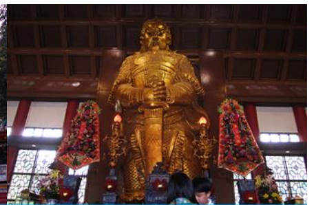
วัดเซกวงเมียว