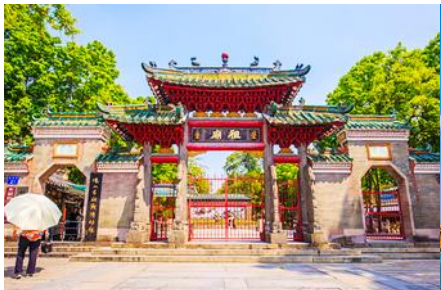
วัดจูเมี่ยว

23.00 น. คณะพร้อมกัน ณ ท่าอากาศยานสุวรรณภูมิ อาคารผู้โดยสารขาออก ชั้น 4 ประตู 10 เคาน์เตอร์สายการบิน 9AIR พบเจ้าหน้าที่บริษัทฯ คอยให้การต้อนรับและอำนวยความสะดวกด้านเอกสารและสัมภาระก่อนการเดินทาง