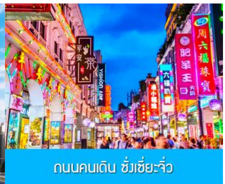
ถนนคนเดิน ชิงเซี่ยจิว