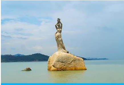
จูไห่พีชเซอร์กักรัล