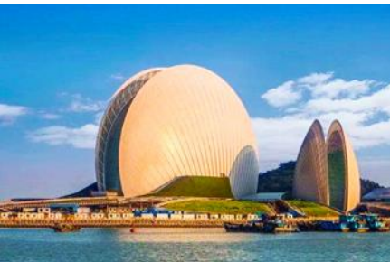
โรงละครจูไห่