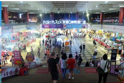
ตลาดใต้ดินกงเป๋ย