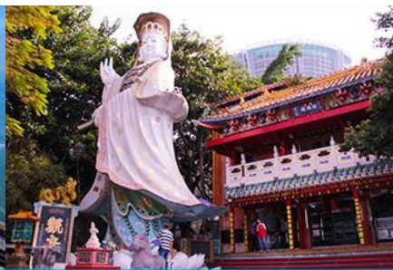
อ่าว Repulse Bay