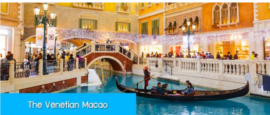
The Venetian Macao

จากนั้นนำท่านผ่านด่านก่งเปี้ยเพื่อเดินทางสู่ เมืองมาเก๊า 澳門 เขตปกครองพิเศษที่อยู่ใต้สุดของจีน ที่ได้ชื่อว่า เป็น ลาตเวกัสของเอเชีย แหล่งรวมสถานบันเทิง คาสีโน โรงแรม รีสอร์ท และร้านจำหน่ายสินค้าแบรนด์เนมชั้นนำจากทั่วโลก อีกทั้งเป็นเมืองท่องเที่ยวยอดนิยมที่นักท่องเที่ยวทั่วโลกเดินทางมาเยือนปีละ 30 ล้านคน.. ข้ามสู่เมืองมาเก๊า