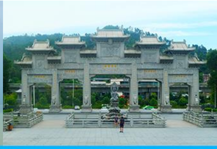
วัดพุทโธ