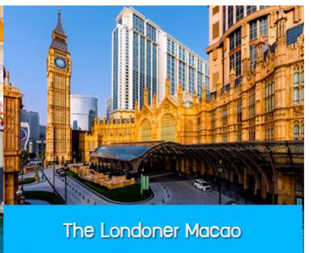
The Londoner Macao

นำคณะขึ้นรถ Shuttle Bus ของโรงแรมเดินทางสู่ เดอะปารีสเซียน มาเก๊า The Parisian Macao และ เดอะลอนดอนเนอร์ The Londoner Macao อัครสถานบันเทิงที่สร้างขึ้นเป็นดาวดวงใหม่ที่เจิดจรัสอยู่เหนือเกาะ