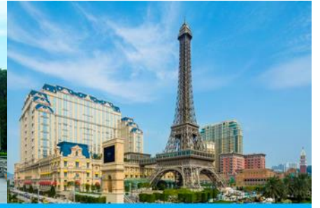
The Parisian Macao

วันที่สาม จูไห่ - รูปปั้นหญิงชาวประมง - วัดผู้ถั่วชื่อ - ศูนย์จำหน่ายหยก-มาเก๊า-เดอะปารีสเซียน-เดอะลอนดอนเนอร์-เดอะเวเนเซียน-จูไห่