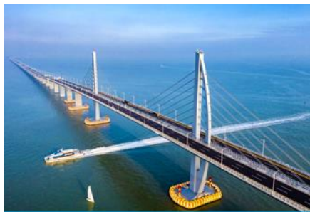
สะพาน ฮ่องกง จูไห่ มาเก๊า

พักที่ IRVINE HOLIDAY HTL OR HUICHANG HTL 3* หรือ โรงแรมในระดับเดียวกันในเมืองจูไห่