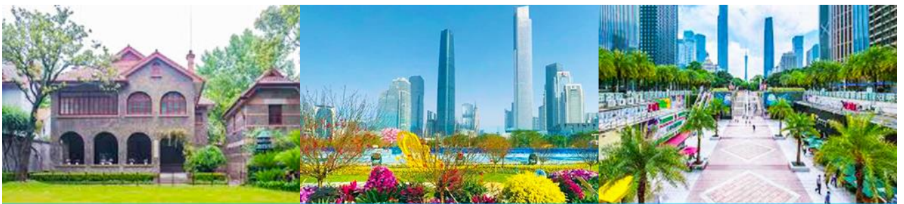
บ้านเกิดชุมชนยัดเซิน

พักที่ IRVINE HOLIDAY HTL OR HUICHANG HTL 3* หรือโรงแรมในระดับเดียวกันในเมืองจูไห่