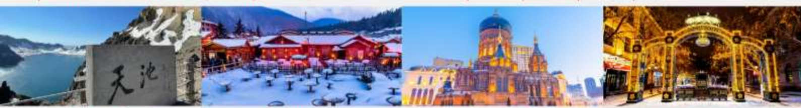
อุทยานจางไป่ซาน