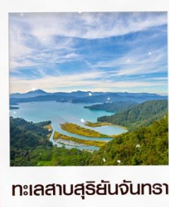
ทะเลสาบสุริยันจันทรา