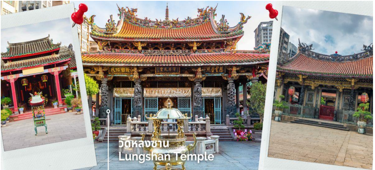
วัดหลงซาน Lungshan Temple

ยังมีเทพเจ้าองค์อื่นๆตามความเชื่อของชาวจีนอีกมากกว่า 100 องค์ด้านในมาจากทั้งศาสนาพุทธ เต๋า และขงจื้อ เช่น เจ้าแม่ทับทิม ที่เกี่ยวข้องกับการเดินทาง,เทพเจ้ากวนอู เรื่องความซื่อสัตย์และหน้าที่การงาน และเทพเย่วเหล่ล่า หรือ ผู้เฒ่าจันทรา ที่เชื่อกันว่าเป็นเทพผู้ผูกด้ายแดงให้สมหวังด้านความรัก