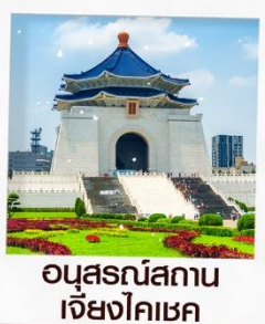
อนุสรณ์สถาน เจียงไคเชก