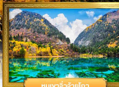
หุบเขาจิวจ้ายโกว