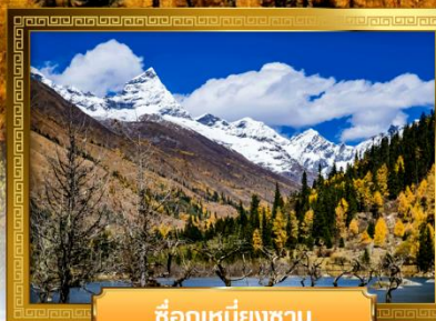
ชื่อภูเขาเหินยงซาน