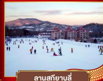
ลานสกียานูลี