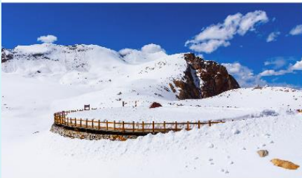
อุทยานตำกูปิงชวน