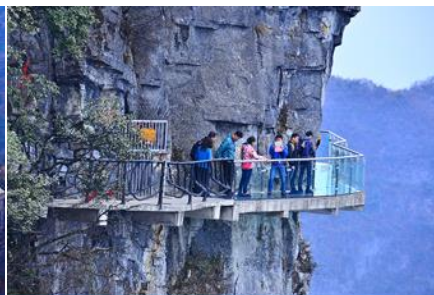
หน้าพลาวยี่ฟ้าทางเดินกระจก