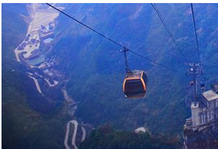
กระเช้าขึ้นเขาเทียนเหมินซาน

https://hk.trip.com/hotels/guzhang-hotel-detail-68614854/chaxitai-holiday-hotel/