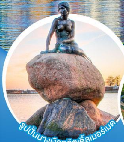
รูปปั้นนางเงือกลิตเติ้ลนอร์มันด์