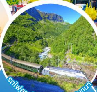
รถไฟสายโรเมนติกฟลัมสบานา