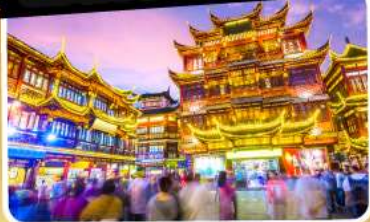
ตลาดร้อยปีเจิ้งหวงเมี่ยว