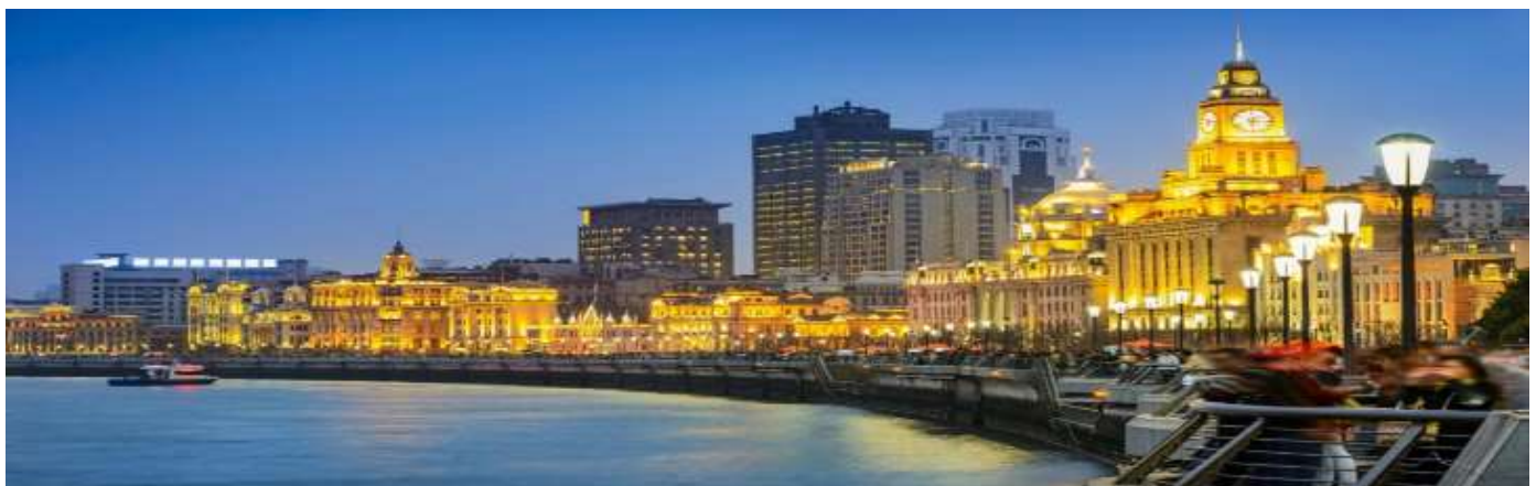
GO1PVG-CA005 ตะลอนเชียงใหม่ ปักกิ่ง 6 วัน 4 คืน (นั่งรถไฟความเร็วสูง) โดยสายการบิน Air China (CA)

07.00 น. เดินทางถึง ท่าอากาศยานนานาชาติเฉิงไฮ้ผู้ตงประเทศจีน เวลาท้องถิ่นเร็วกว่าประเทศไทย 1 ชั่วโมง (เพื่อความสะดวกในการนัดหมาย กรุณาปรับนาฬิกาของท่านเป็นเวลาท้องถิ่น) หลังจากท่านได้ผ่านพิธีการตรวจคนเข้าเมืองและศุลกากร