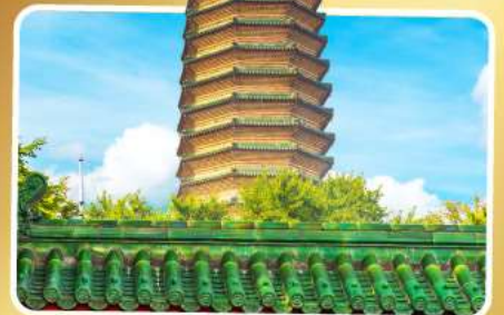
วัดพระเจี๊ยะท้าว