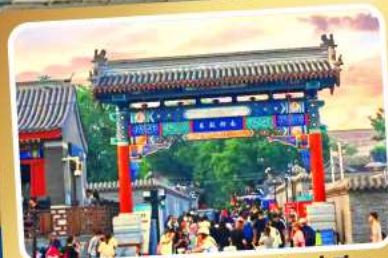
ถนนโบราณหนานหลวู่เซียง