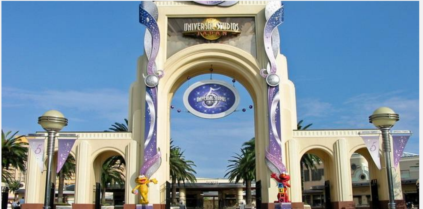
SUPER NINTENDO WORLD™