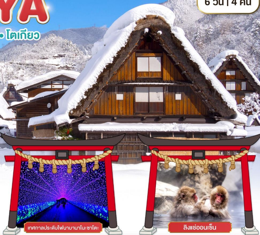
เทศกาลประดับไฟนาคาโนะ ซาโตะ