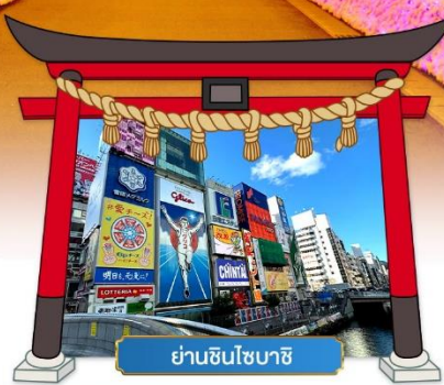
ย่านชินไซบาชิ