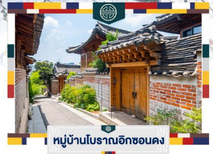
หมู่บ้านโบราณอิกซอนดง