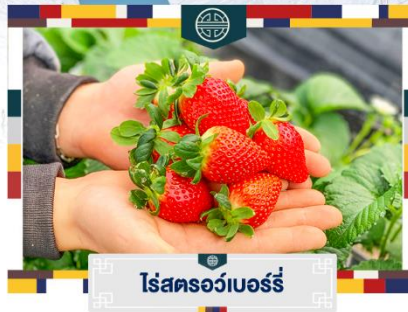
ไร่สตอร์วเบอร์รี่