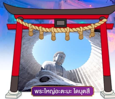
พระใหญ่อะตะมะ ไดบุตสึ