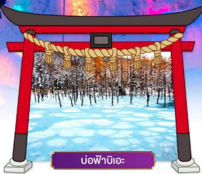
บ่อน้ำปิเอะ