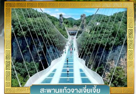
สะพานแก้วจางเจียเจี๋ย

เดินทางโดย: สายการบินเวียดนามแอร์ไลน์ (VZ)