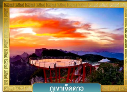
ภูเขาเจ็ดดาว