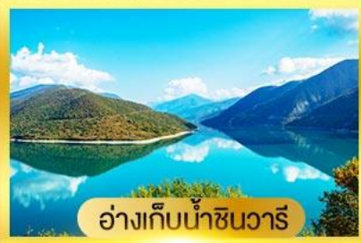
อ่างเก็บน้ำซิวารี