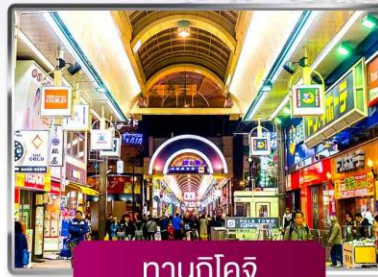
กานุกิโคจิ