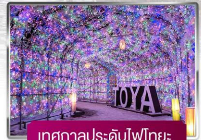
เทศกาลประดับไฟไทยะ