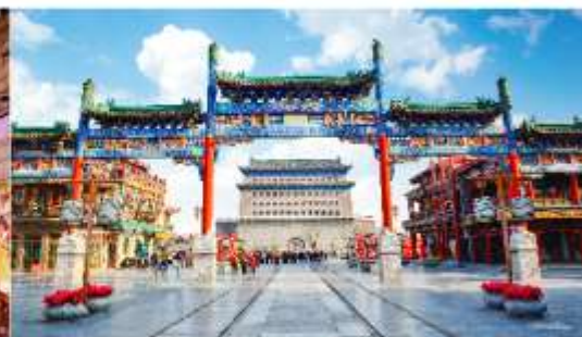
ถนนโบราณเฉียนเหมิน