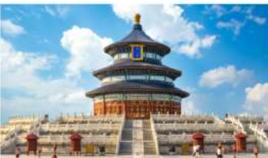
หอบูชาฟ้าเทียนถาน