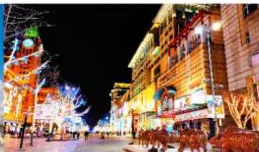
ถนนหวังฟูจิ่ง