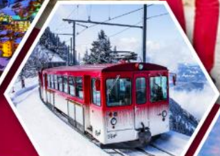
รถไฟใต้เขาริกิ