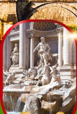
น้ำพุทรีวี