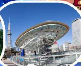
ซอปปิงซาคาเอะ